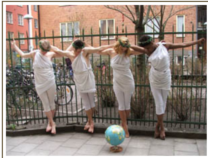
KVALITETSTEATERN SPELAR MAN- EN UTREDNING. FOTO: SIRI HILL

Föreställningen inleds med att tre tjejer som kallar sig Fikssion förklarar att de ska presentera ett projekt de håller på med om tsarer och faraoner. Men tyvärr, får vi veta, blir framställningen inte optimal, eftersom Alexander inte är med.